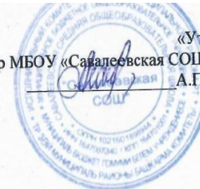
График оценочных процедур МБОУ «Савалеевская СОШ» Заинского муниципального района РТ на первое полугодие 2024-2025 учебного года